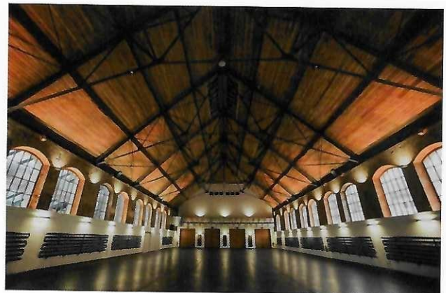
Phoenixhalle Römerkastell; ARTE Kunstmesse Stuttgart

WEBSEITE | https://arte-kunstmesse.de/osnabrueck/