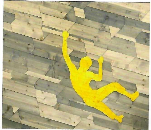
Clemens Gentsch auf der ARTE Osnabrück