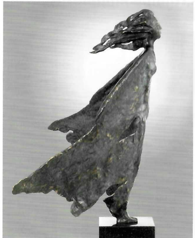
Eckhard Wähning auf der ARTe Osnabrück

Vom 15. bis 17. März setzt die 18. Ausgabe der Photo/Media Art Fair der C.A.R. erneut einen ihrer Schwerpunkte auf die Fotografie, präsentiert neue Tendenzen in der Kunst sowie ein umfangreiches Rahmenprogramm. Mit der Photo/