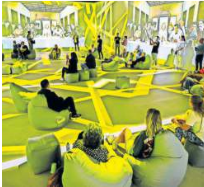
Moderne Technik macht es möglich, dass das Publikum ins Gemälde „Das letzte Abendmahl“ geradezu eintauchen kann.

Leonardo da Vincis Kunstwerk in Mailand misst etwa neun auf vier Meter. In der Schleyer-Halle erleben die Besucher „Das letzte Abendmahl“ als 360-Grad-Projektion in Originalgröße. red