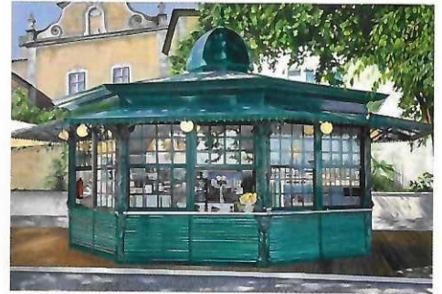
Anke Rohde; TH024; Miradouro Sao Petro de Alcantara, Lisboa; 2022, Öl auf Leinwand, 80 cm x 115 cm © Anke Rohde

Weitere Infos: ARTE Kunstmesse https://arte-kunstmesse.de